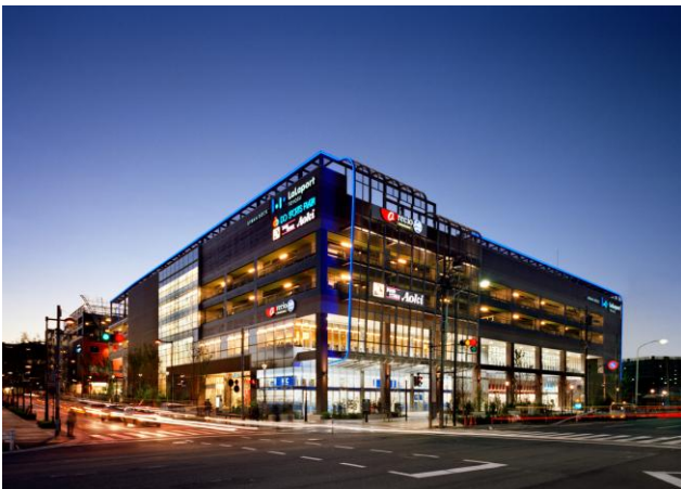
アーバンドック ららぽーと豊洲（外観）