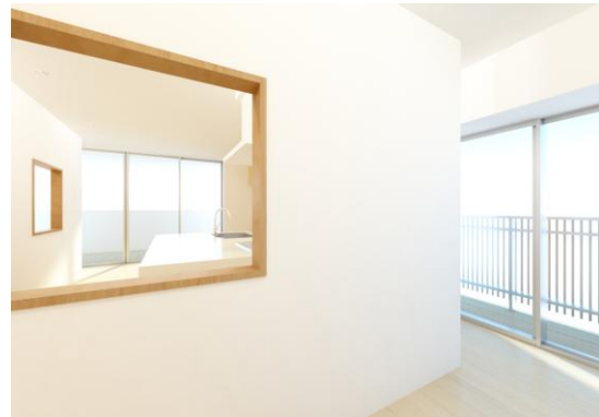
妻のリビングと夫のリビングをつなぐ壁窓