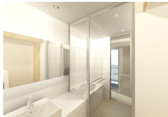
廊下側からも出入可能な2ウェイ浴室

■今後も、「すまいとくらしの未来へ」というコーポレートステートメントのもと、デザイン性の高い上質な住まいの提供と新たな暮らしの提案に努めてまいります。