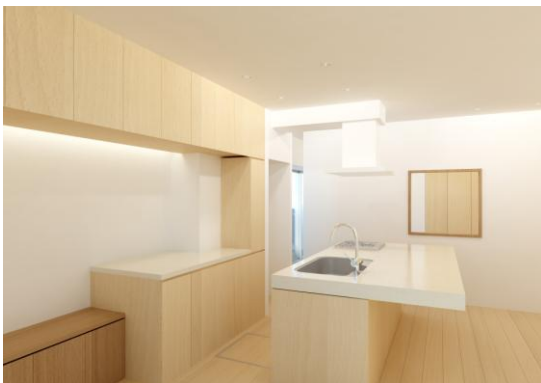
料理をしながらコミュニケーションを 図ることができるアイランドキッチン