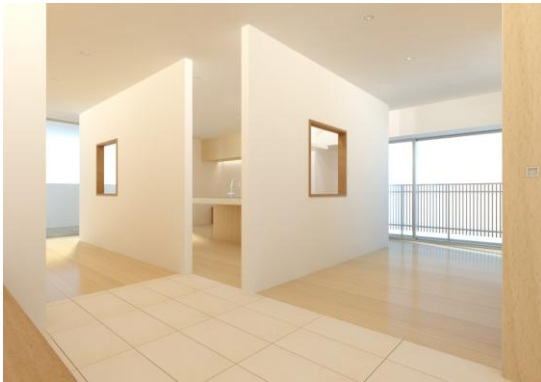
妻・夫のリビングとつなげて 利用できる趣味のリビング