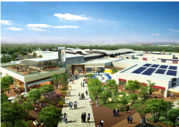
フードコート側エントランス（イメージ）