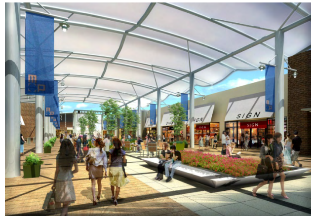
ピアストリート（イメージ）