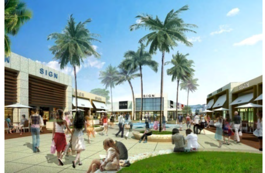
コーストプラザ（イメージ）