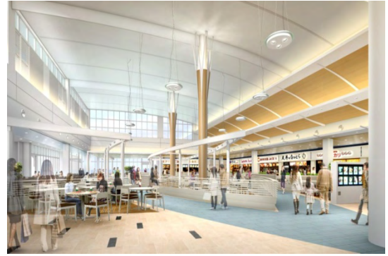
フードコート（イメージ）