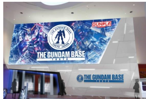
「THE GUNDAM BASE TOKYO」イメージ

※「ガンダムフロント東京」内にある「STRICT-G」は「THE GUNDAM BASE TOKYO」の開業に合わせリニューアルします。