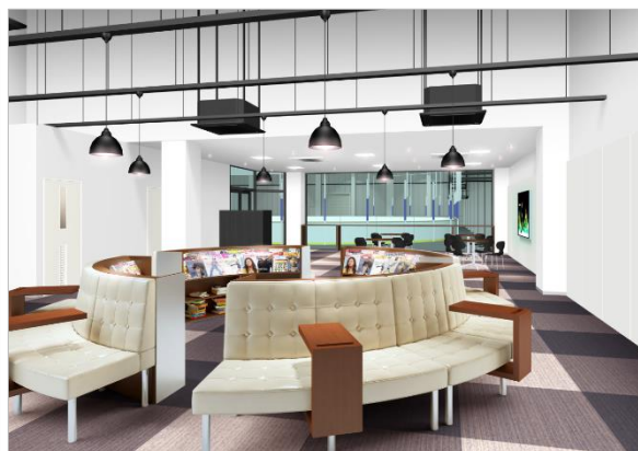
リニューアル後ラウンジ イメージパース