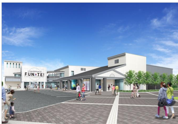
リニューアル後スポーツ棟 イメージパース

「アイスリンク仙台」HP: http://icerink-sendai.net/