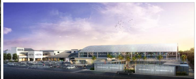
「三井不動産 SPORTS LINK CITY FUN-TE!」イメージパース