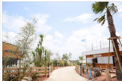
WILD BEACH 木更津