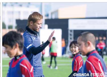
「SOLTILO FAMILIA SOCCER SCHOOL」