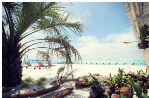
WILD BEACH 木更津