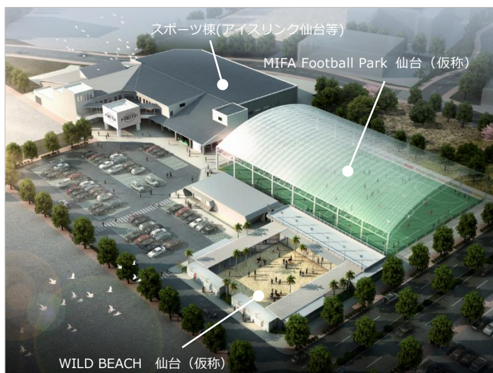
「三井不動産 SPORTS LINK CITY FUN-TE!」イメージパース

また、本プロジェクト推進にあたり、全体の施設名称を「三井不動産 SPORTS LINK CITY FUN-TE! (ファンテ!)」へ改称します。