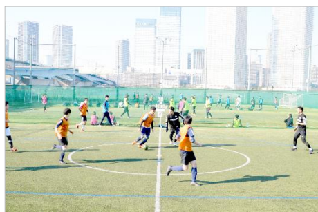
MIFA Football Park イベント