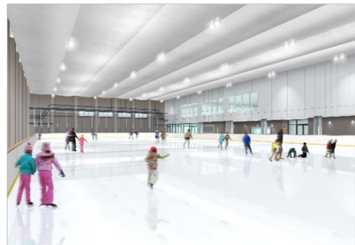
「アイスリンク仙台」改修後スケートリンク イメージパース