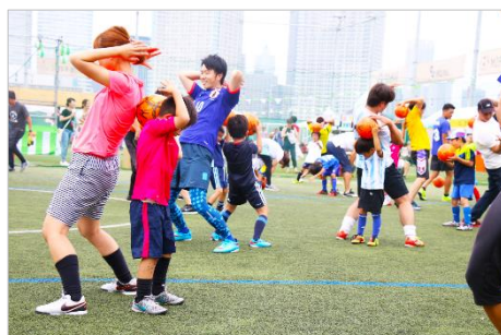
MIFA Football Park イベント