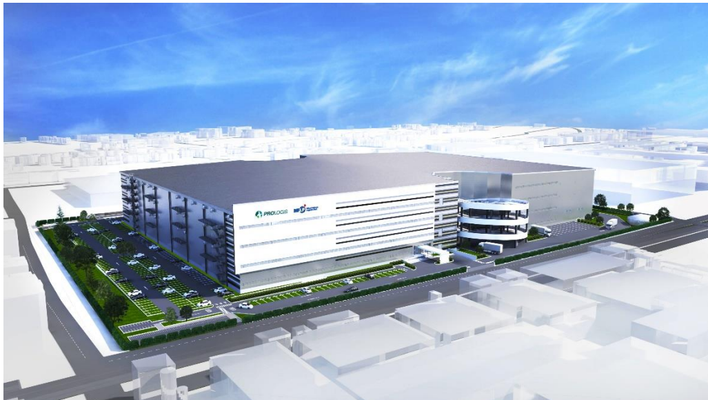
「MFLP プロロジスパーク川越」完成イメージ

プロロジスは、物流不動産のリーディング・グローバル企業であり、国内でも最多の物流施設の開発実績を持つ。一方、三井不動産は、不動産業界国内最大手の総合デベロッパーとして幅広い顧客ネットワークを有する。双方の強みを活かし、共同事業の可能性を探る過程で、このたび「MFLP プロロジスパーク川越」の開発が実現した。双方のノウハウを結集し、より先進的で質の高い物流施設の提供をめざす。