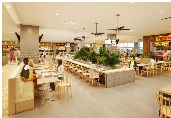
西館フードコート CG