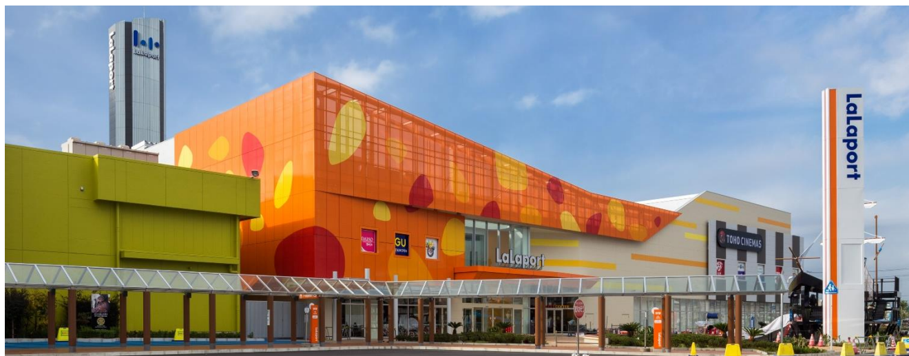
三井ショッピングパーク ららぽーと TOKYO-BAY 外観