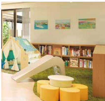
キッズスクエアディスカバー完成予想図

「キッズスクエアディスカバー」に、エイブルアート・カンパニーの協力のもとパラアーティスト（障害をもったアーティスト）が自由な発想で制作した、ここでしか鑑賞できない作品を展示。気軽にアートに触れられる環境が、子どもたちの様々な可能性を広げます。