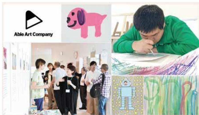
パラアートイメージ写真