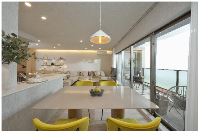
リビングダイニング①

モデルルームは、レディースファッションブランド「SNIDEL(スナイデル)」やルームウェアブランド「gelato pique(ジェラートピケ)」などを運営するマッシュグループによるコーディネート提案を採用。ファッション業界において、積極的にSDGsに取り組んでいる同社の発案のもと、家具の一部に「リユース家具」を採用します。リユースマーケットにて購入した家具にパーツの変更や生地の変更等のリノベーションを行い、新たな価値を付加したものをモデルルームに設置することで、資源の有効活用に貢献いたします。