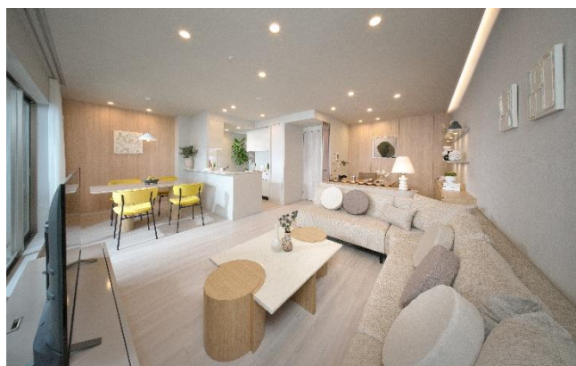
リビングダイニング②