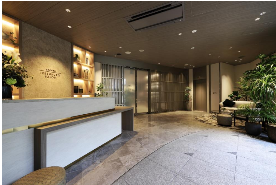
【本サロンエントランス】

今後も、当社の全住宅事業のブランドコンセプトである「Life-styling × 経年優化」のもと、多様化するライフスタイルに応える商品・サービスを提供するとともに、安全・安心で快適にらせる街づくりを推進し、持続可能な社会の実現・SDGsへ貢献してまいります。