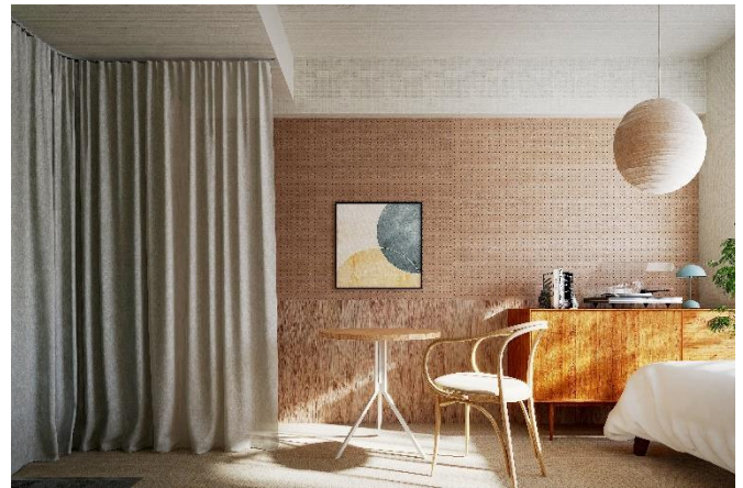
【「SOCO HAUS KORAKUEN」完成予想CG】