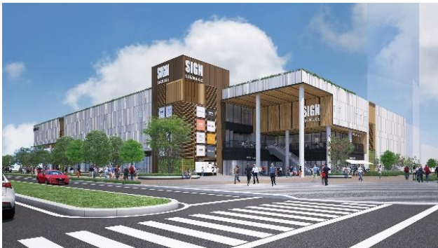
商業施設 完成予想CG

快適な日常をサポートする商業施設や生活利便施設のほか、道路、交通拠点、公園、学校などの暮らしに必要な施設が一斉に整備されています。「PORT VILLAGE」の街区内には、保育園が開設されるほか、隣接地には中央区により小中学校が新設され、子育て世代の方にとっても安心して暮らせる環境が整備されています。