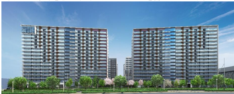
日本建築の伝統手法を取り入れたファサードデザイン

建築物のスカイラインにアクセントを与え、伸びやかさと動きのある手法「ダイナミックシンメトリー」を取り入れ、日本の洗練された建築の伝統が感じられる美しいスカイラインをデザイン。さらに 3 層の構成、縦の分割により、軽やかさを表現して建築の圧迫感を軽減。重ねること動きや奥行きを感じさせる「ひだ」、不均質なものが集合することで生まれる秩序「もやい」、しなやかな曲線美を創出する「照り・むくり」を外装の要素に取り入れ、それらの要素を「結」うことで、個性がありながら秩序を感じる建築とランドスケープを創出しています。