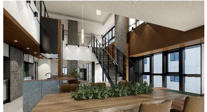
シェアハウス共用スペース完成予想CG (D棟)

※3:定員は約200名。PORT VILLAGEのほかにも、商業施設「三井ショッピングパーク さららテラス HARUMI FLAG」内にも開設されます。