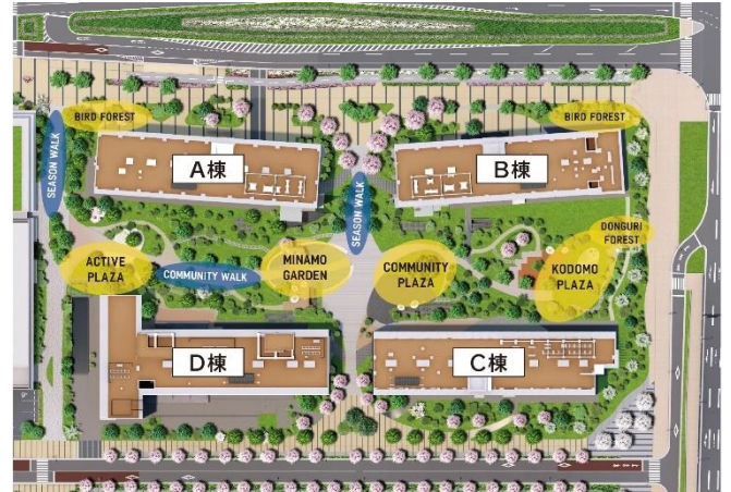
PORT VILLAGE 敷地配置図