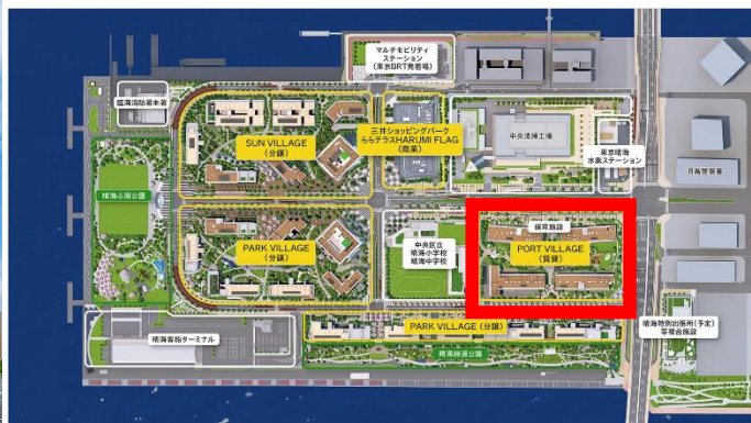
HARUMI FLAG 全体敷地配置図