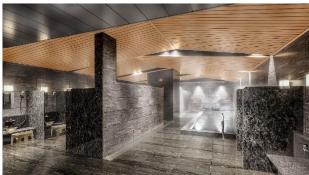
大浴場 完成予想CG (A棟)

共用部分には賃貸住宅では有数の大きさを誇る約350㎡もの大浴場のほか、多目的に使用できるイベントスペース、キッチン付きのパーティールーム、フィットネスルーム、シアタールームも完備。このほか、ワークスペースや会議室も設置し、居住者の在宅ワークやビジネスを支援します。また多目的に使用できるイベントスペースは、街区外の居住者や地域の人々が利用できる、交流やコミュニティ形成の場としても活用されます。