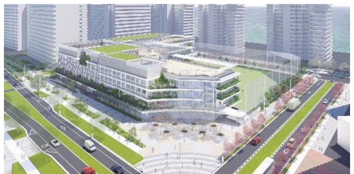
小中学校 完成予定CG