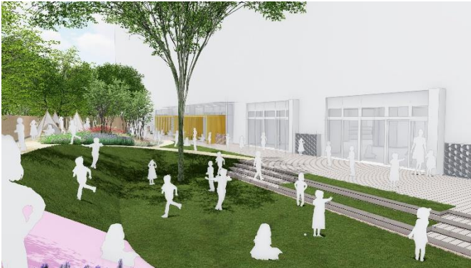
保育施設完成予想CG (B棟)

「PORT VILLAGE」は、多様な世代、ライフスタイル、価値観をもつ人々が暮らす「HARUMI FLAG」の多様性を象徴する街区です。賃貸街区はひとり暮らしからDINKS、子どものいる家庭、シニア層までお住まいいただける幅広いプランバリエーションを用意した一般賃貸住宅のほか、シニアレジデンス、ケアレジデンス、シェアハウス、保育施設 (※3) などで構成されます。一般賃貸住宅は、在宅ワークにも対応するゆとりある仕様とし、中期滞在にも対応する家具付賃貸住宅も提供。ここで暮らす多様な人々が、ライフステージやライフスタイルの変化に合わせて住み替えることを可能にし、持続的で活力を持った街を実現します。