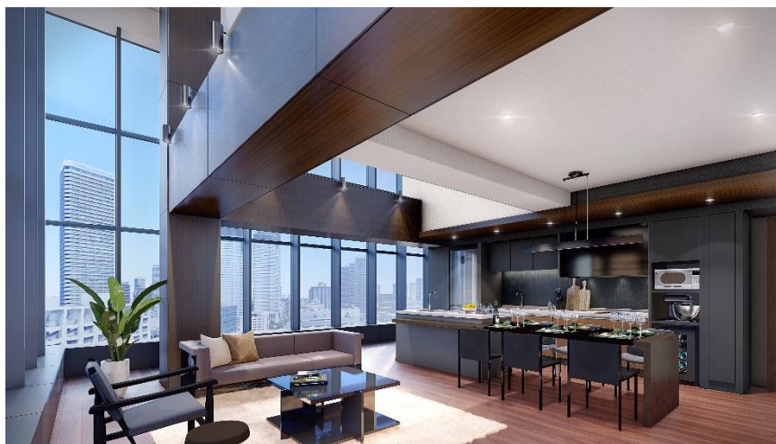
メゾネット住戸 完成予想CG (B棟) (※2)

一般賃貸住宅総戸数1,258戸・総専有面積約58,800㎡という大規模な賃貸物件において、ひとり暮らしからDINKS、子どものいる家庭、シニア層までそれぞれの豊かな生活を実現する、1R～3LDK、メゾネット住戸まで幅広いプランバリエーションをご用意。