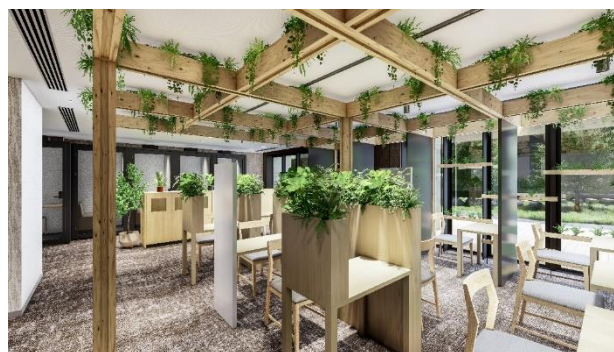
ワークスペース 完成予想CG (C棟)