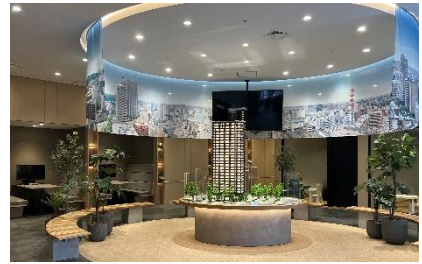
【仙台一番町レジデンシャルサロン】

本物件は、東北地方のマンションで当社初となる BELS 認証における「ZEH-M Oriented」の取得を予定。ZEH-M Oriented 基準の断熱性や住設機器の設置により、室内の消費エネルギー量を低減、電気代等も抑えられ、地球環境はもとより家計にもやさしいマンションを目指します。さらに、販売センターの一部部材には、地元宮城県産の木材を使用することで、森林資源の循環に寄与して参ります。