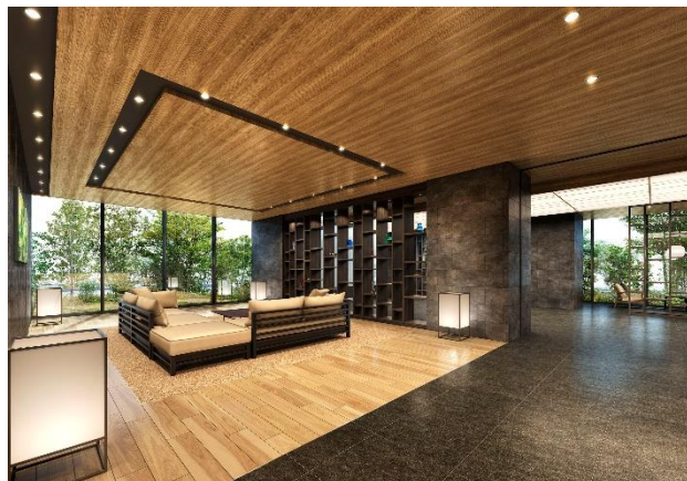
【エントランスラウンジ完成予想 CG】