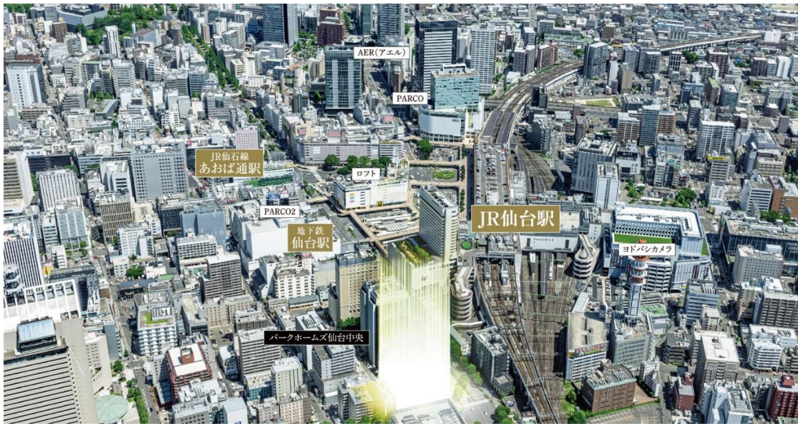
【現地周辺航空写真】

本物件は、JR「仙台」駅徒歩 5 分、仙台市交通局地下鉄東西線・南北線「仙台」駅徒歩 3 分と仙台市のなかでも特に交通利便性に優れた場所に誕生します。ここは、「仙台 PARCO」や「S-PAL 仙台」といった駅前の大規模商業施設等が集積するエリアでありながら、愛宕上杉通と北目町通という 2 つの並木道が交差する角地立地のため、杜の都ならではの緑を身近に感じられるロケーションが魅力です。さらに、本物件は JR「仙台」駅徒歩 5 分以内に位置する免震構造マンションとして約 10 年ぶりの供給です。長いスパンで考える分譲マンションだからこそ、時代に合った安全性を追求してまいります。