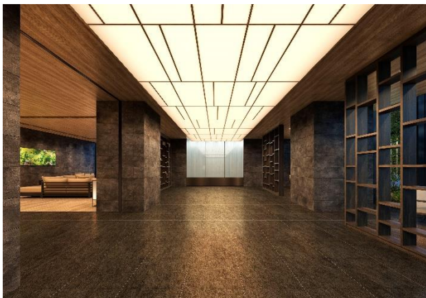
【エントランスホール完成予想 CG】

共用部にはエントランスホールとラウンジをご用意しています。デザインにおいては「ホスピタリティを感じる迎賓空間」をイメージし、仙台城の石垣を思わせる壁面や秋保大滝の水面と重なるガラス装飾、障子や縁側といった日本古来のモチーフを随所に取り入れています。