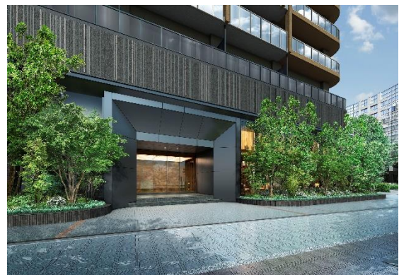
【エントランスアプローチ完成予想 CG】