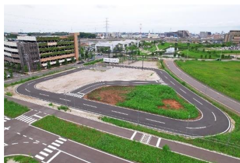
KOIL MOBILITY FIELD

●2023年10月3日：柏の葉スマートシティにて日本初、電気自動車への走行中給電の公道実証実験を開始 https://www.mitsufudosan.co.jp/corporate/news/2023/1003/