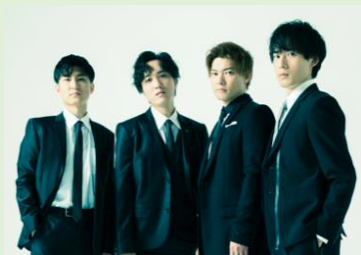
REAL TRAUM (リアル・トラウム)