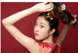
和久井 映見 （ワクイ エイミ） ヴァイオリン（クラシック）