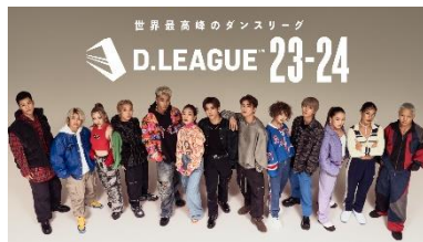
初参加のプロダンスリーグ「D.LEAGUE」

★テクノロジーを駆使した革新的パフォーマンス 大反響の「ナイトショー」を今年も開催