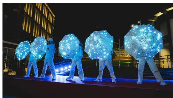
ナイトショー（昨年の様子）

このショーはテクノロジーをパフォーマンスに融合させ、伝統ある日比谷という場所で未来を予感させます。パフォーマンスと最先端の技術を同時に体験できる「観る」だけに留まらないエンターテインメントの挑戦をぜひ体感してください。