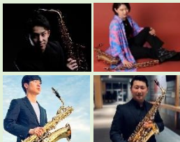
Ensemble 翡翠 (アンサンブルヒスイ)