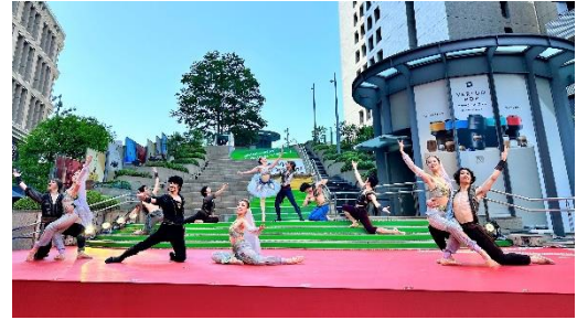
ステップショー（昨年の様子）

日比谷ステップ広場に大型ステージを設け、様々なジャンルの本格的なエンターテインメントを無料で楽しめる劇場のショーケースです。日比谷で人気のミュージカルやオペラに加え、ダンス、音楽など様々なジャンルのエンターテインメントのプロフェッショナル達がステップ広場に集結します。普段は劇場の中でしか観ることができないパフォーマンスをオープンエアの空間で、無料でお楽しみいただけます。