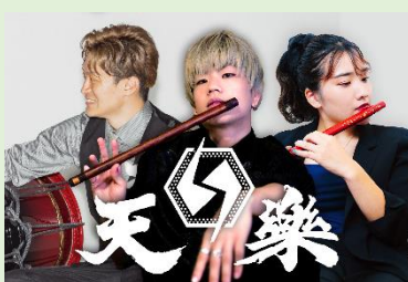
和楽器ユニット天楽 (ワガッキユニットテンガク)