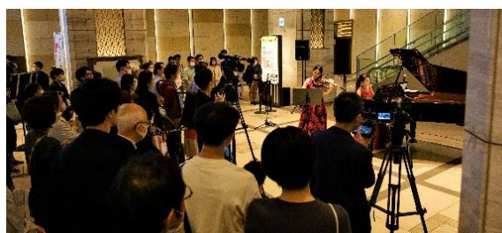
まちなか劇場（昨年の様子）

Hibiya Festival 2024 に先立ち、「あなたがNEXTアーティスト～若手応援プロジェクト～2024」と題して、2023年11月から様々なジャンルの若手アーティストを公募してきました。演出家宮本亜門さんから11名のプロフェッショナルが審査員となり選出された11組の「NEXTアーティスト」たちが、特別なパフォーマンスを披露します。街とエンターテインメントの融合をお楽しみください。