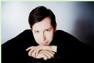
アレクセイ・シチエフ