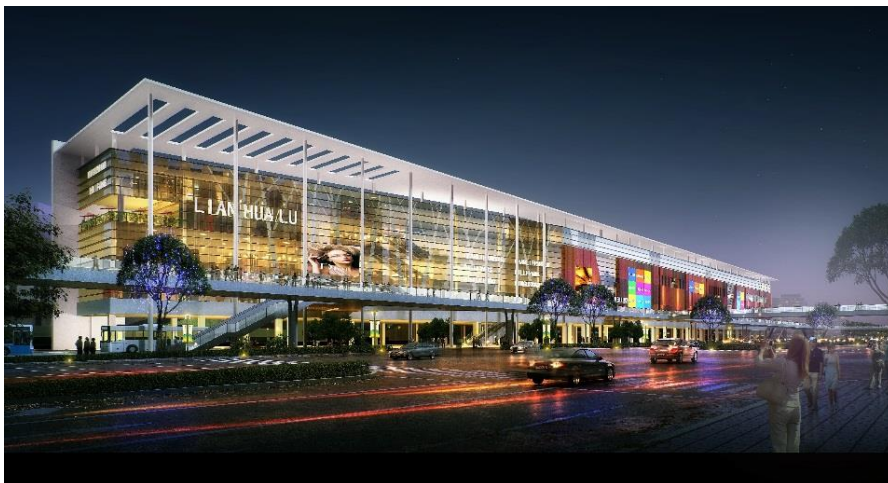
“上海莲花路车站大楼商业设施（暂名）”效果图

为前往市中心工作和学习的人们以及周边居民提供便捷生活服务与新型生活方式的高敏感度商业设施，丰富餐饮类店铺类目，计划引入具备建设性和影响力的小型店铺来完成店铺布局。另外，我们还将利用以往经营亚洲地区商业设施的经验，积极引进日系品牌商户。