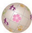
FTSE Blossom Japan