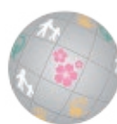
FTSE Blossom Japan Sector Relative Index