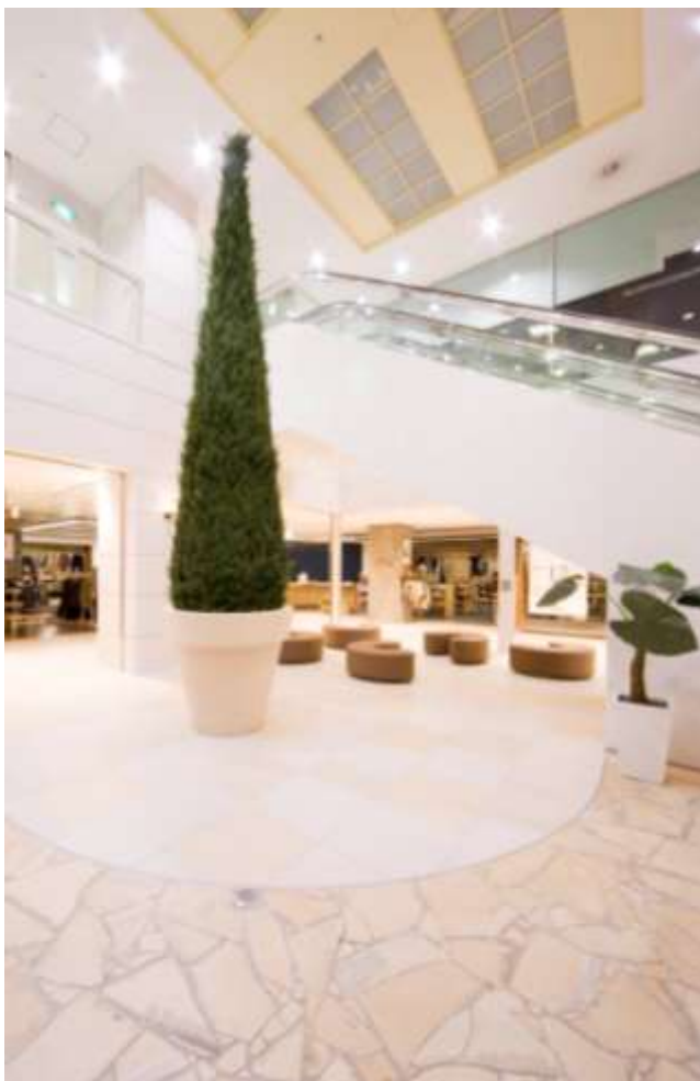
休憩スペースには緑とレザーのベンチを配置