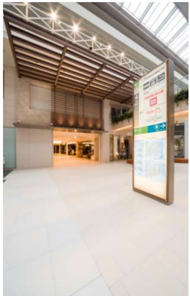
アルパーク通りに点在していたサインを大型サインにし、より分かりやすく