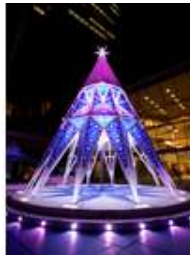
KIRIKO Tree 点灯時間 16:00~24:00