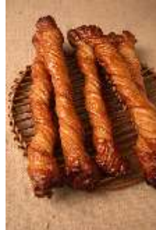
be 「サクリスタン」 378円