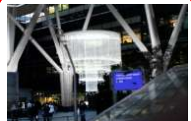
Welcome Chandelier 点灯時間 16:00~24:00