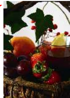
Okawari.jp 「ホットサンテリア」 価格未定