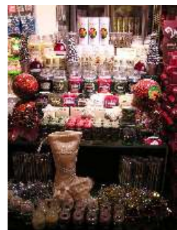
Green DeLi ディスプレイイメージ画像 クリスマスグッズ 200円～