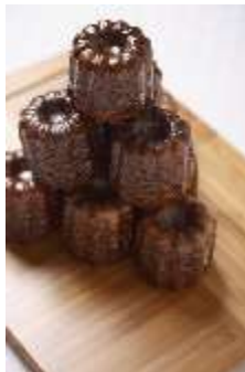
be 「カヌレ ド ボルドー」 231円