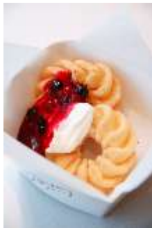
Belberry 「パパナッシュホットベリーソース」 700円