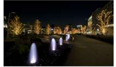
ツリーイルミネーション 点灯時間 16:00~23:00 ※プラザのみ24:00