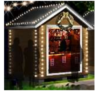
「マルシェ・ド・ノエル」 店舗イメージ画像