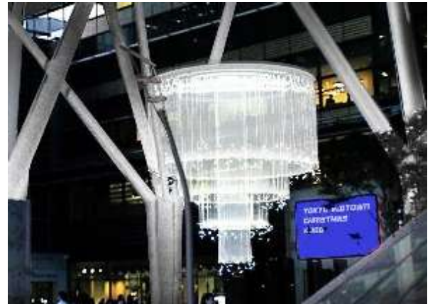
「Welcome Chandelier」 イメージ画像

5 つの基本色から、濃淡様々な色に変化し、来街者に対する多様なおもてなしを表現します。