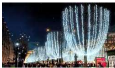
シャンゼリゼ・イルミネーション 点灯時間 16:00~23:30 ※外苑東通りのみ24:00まで