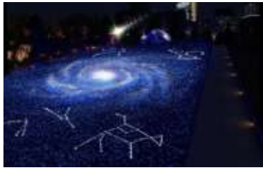
スターライトガーデン 点灯時間 16:00~23:00