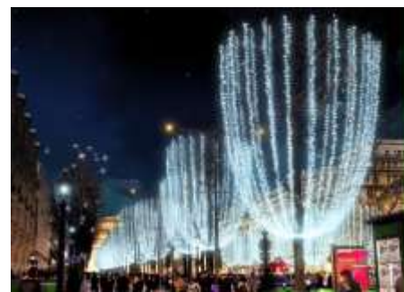
さくら通り「シャンゼリゼ・イルミネーション」