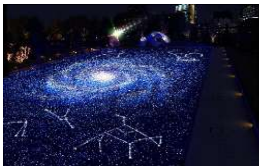
芝生広場「スターライトガーデン」

東京ミッドタウン（事業者代表 三井不動産）は、今年、2 度目のクリスマスを迎えます。昨年に引き続き、クリスマスのメッセージは“誰かが誰かのサンタクロース”。「大切な人の幸せを願う誰もがサンタクロースである」というコンセプトのもと、自分の大切な恋人や友人、家族を想う、この街に訪れるすべての人が幸せになりますように…そんな想いを込めて、今年もクリスマスイルミネーションを中心とした様々なイベントを展開します。