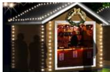
マルシェ・ド・ノエル 営業時間 16:00~21:00