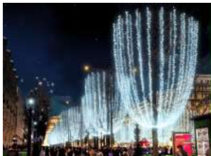
「シャンゼリゼ・イルミネーション」 イメージ画像