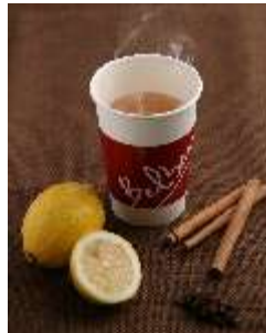
Belberry 「ホットジンジャーレモネード」 450円