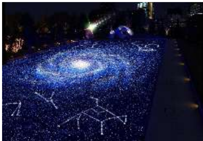
「スターライトガーデン」 イメージ画像