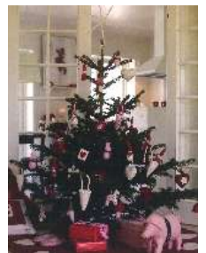
ツリー装飾 イメージ画像