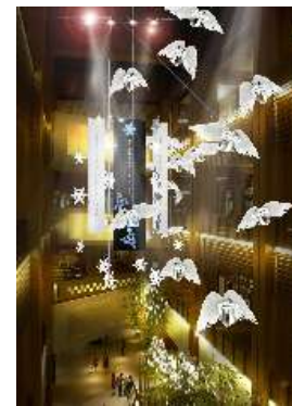
クリスマス装飾イメージ

お客様への感謝を天使からの贈り物に見立て 来街する皆様が楽しい時間を 過ごしていただけるよう想いを込めた装飾です。