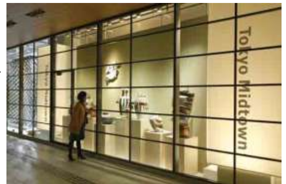
昨年の展示の様子（プラザ B1F メトロアベニュー）