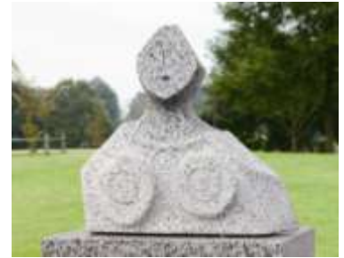
松永真氏作品画像

今年もミッドタウン・ガーデンに、稲田みかげ石を使用した、日本を代表するグラフィックデザイナー団体 JAGDA と石工技術者のコラボレーション作品を多数展示します。デザイナーの感性と匠の技をお楽しみください。 ※稲田みかげ石とは、茨城県笠間市稲田地区一帯を産出地とし最高裁判所、国会議事堂等多くの有名建造物に使われている石の最高級ブランドです。