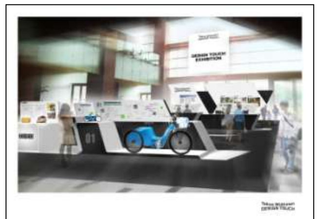
「DESIGN TOUCH Exhibition」イメージパース