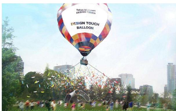
「DESIGN TOUCH BALLOON」イメージパース

今年で2回目を迎えた「Tokyo Midtown Award」。今年も<アートコンペ><デザインコンペ>の2部門を設け、次世代を担うアーティスト、デザイナーとの出会いと応援を目指し、幅広く作品を募集しました。総計1,677点の応募作品の中から、計13作品を選出予定。昨年のデザインコンペの入賞作品は商品化され、東京ミッドタウンのショップでも販売されています。