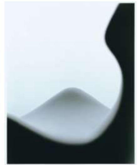
B&B Italia 「GRANDE PAPILIO」 アームチェア