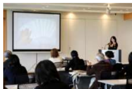
前回の講義の様子

毎年好評を博している「DESIGN TOUCH Conference」。東京ミッドタウンのショップやデザイン関連施設などの協力により、多彩なトップクリエイターたちを講師陣に迎え、「デザイン」をテーマとした無料のワークショップや講座を多数開催します。