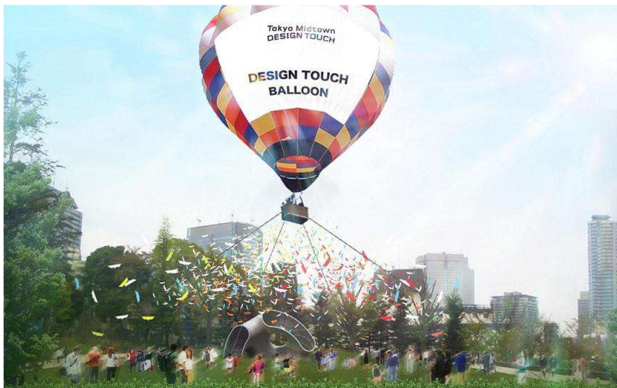
「DESIGN TOUCH BALLOON」イメージパース

「人々の夢」が書き込まれたデザイン紙飛行機「TONBY(トンビー)」を気球から飛ばす、参加型のスペシャルコンテンツも開催予定。詳細は、9月中旬発表予定。