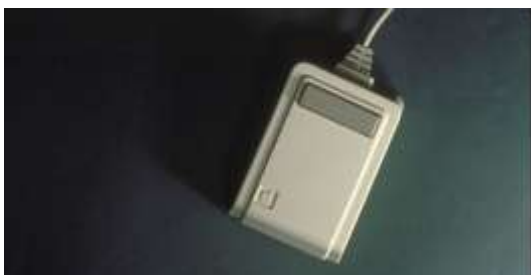
■ Apple Mouse （1980年発表）

Apple から発表されたモデル、Lisa 用に開発され、その後の Macintosh に適合されたマウス。その基本的な構造は以後量産されたマウスに応用されている。