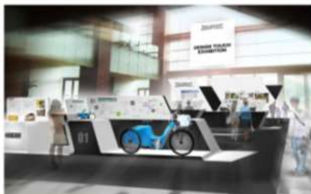
「DESIGN TOUCH Exhibition」イメージパース