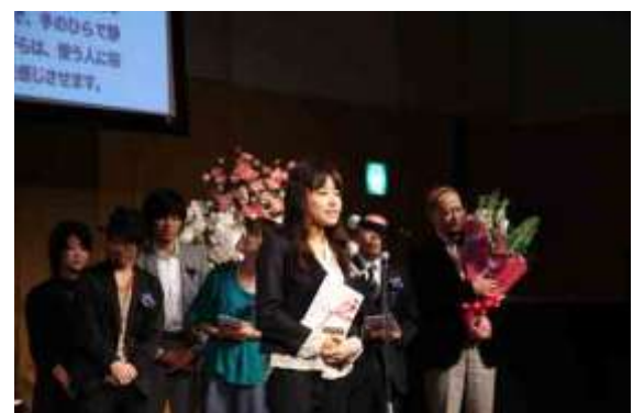
昨年の授賞式の様子

Tokyo Midtown Award 2009 を振り返りながら、アワードのポイントについてトークを行います。