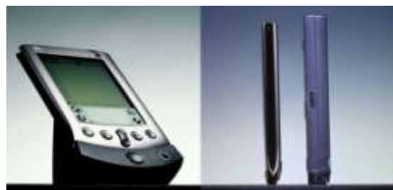
■ Palm V （1999年発表）

Apple から発表されたモデル、Lisa 用に開発され、その後の Macintosh に適合されたマウス。その基本的な構造は以後量産されたマウスに応用されている。