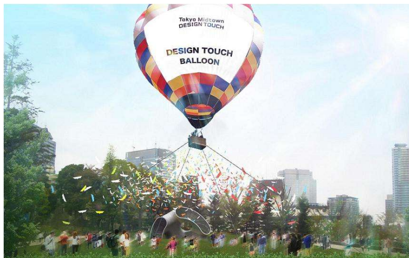
「DESIGN TOUCH BALLOON」イメージパース

「Tokyo Midtown DESIGN TOUCH 2009」では、「デザインがいかに人々の夢を叶えてきたか」にフォーカスし、日常の課題や問題点などがデザインによって解決されてきた事例を、そのデザインのプロセスと共に展示するほか、空を飛ぶ夢を200年以上も前にカタチにした熱気球の乗船体験など、デザインを体感し、楽しむための様々なイベントを開催します。