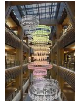
「ウェルカムシャンデリア」演出イメージ