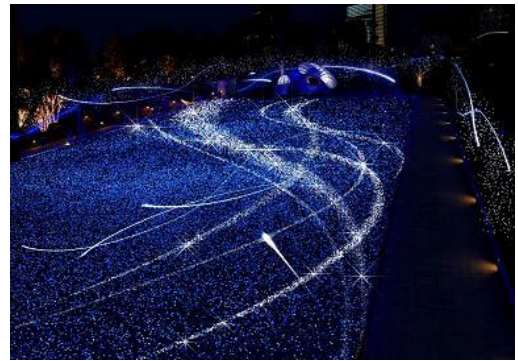
「スターライトガーデン」イメージパース

約2,000㎡にも及ぶ広大な芝生広場に、東京ミッドタウンの象徴的なクリスマスイルミネーション「スターライトガーデン」が、新たな演出で登場します。3年目となる今年は、夜空に輝く「スターダスト」をイメージ。周辺の樹々にもイルミネーションを施すなど、より壮大で幻想的な宇宙空間を表現します。さらに、スペシャルプログラムとして、約20分に一度頭上より舞い降りる流れ星が、芝生広場に星屑となって立体的にきらめきます。