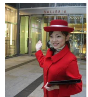
イルミネーションコンシェルジュ