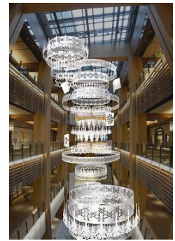
「ウェルカムシャンデリア」イメージパース

美しい雪の結晶などのペーパークラフトの中に、サンタクロースが 4 人隠れています。館内を巡りながら、家族やカップルでサンタクロースを探していただける、楽しい“隠れキャラクター”演出です。