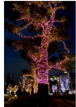
「奇跡の木」 昨年画像