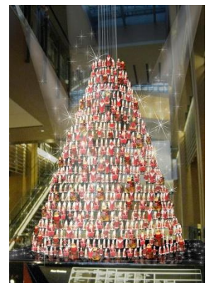
「サンタツリー」イメージパース

1,500 体を超えるサンタクロースの中に、1 体だけ、福の神“恵比須様”が隠れています。上記「ウェルカムシャンデリア」同様、家族やカップルで探していただける“隠れキャラクター”演出です。