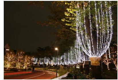
「シャンゼリゼ・イルミネーション」 昨年画像