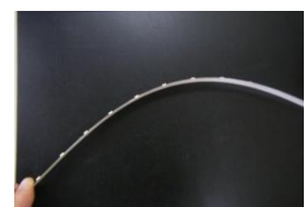
新型LEDライン （横から写したもの）

プリズムアベニューには、東京ミッドタウンのイルミネーションに合わせて開発された、全長約500mに及ぶ、薄さ3.2mm、幅12mmの特殊な新型LEDライン（線状のもの／右写真）を採用しています。このLEDラインには、2.5cm間隔で高輝度のフルカラーLEDを埋め込んでおり、あらゆる光を自在に灯すことができます。フルカラーLEDの極薄ライン形状での使用は、世界でも初めてです。