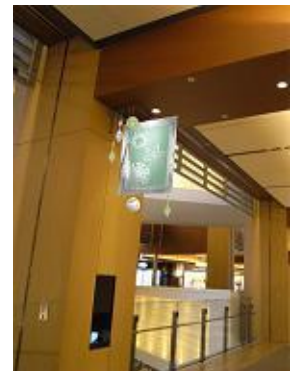
展示イメージパース