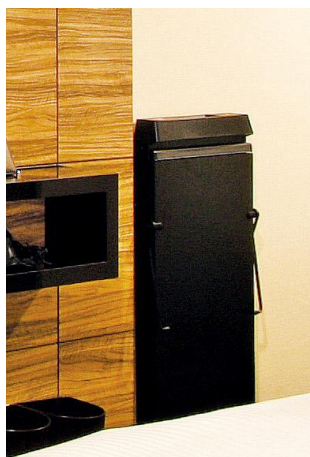
ズボンプレスサー