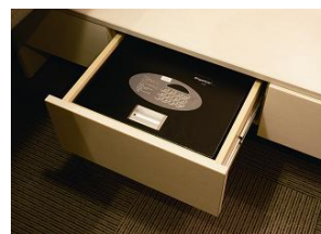
セーフティーボックス