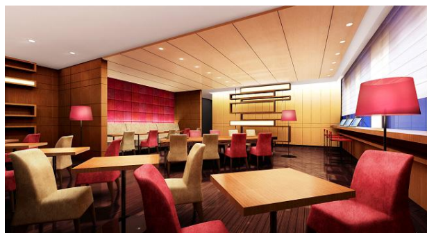
「ゲストラウンジ」完成予想CG