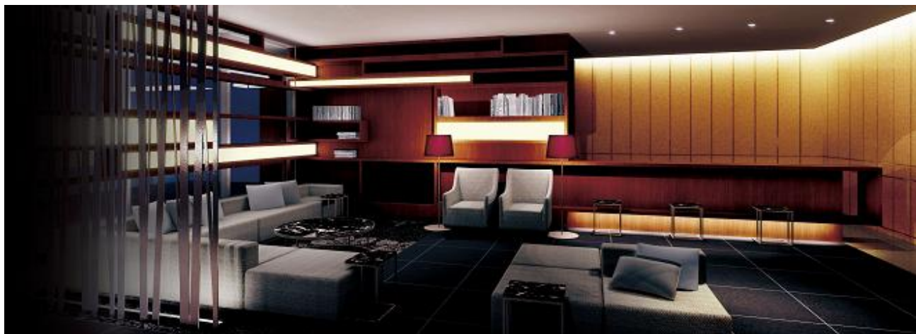
「ロビーラウンジ」完成予想CG

■三井不動産グループは、JR「札幌」駅南口徒歩4分の札幌市中央区北5条西6丁目において開発推進中の「三井ガーデンホテル札幌（客室数 247 室）」を6月2日（水）にグランドオープンいたします。なお、2月1日（月）より宿泊予約受付を開始いたします。