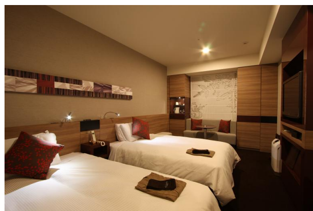
バーガンディ (スタンダードツイン)