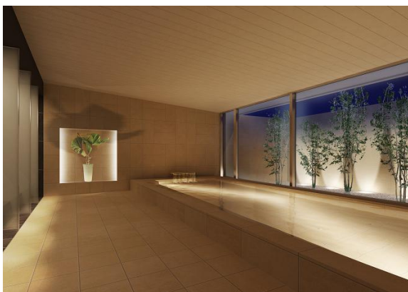
「ガーデン浴場」完成予想CG