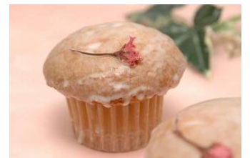
チェリーブロッサムマフィン

軽井沢で有名な老舗ブーランジュリー「浅野屋」。春に向けた新商品として、桜パウダーで春らしい色に仕上げた「桜ボンジュール」、桜のリキュールと塩漬けをトッピングした「チェリーブロッサムマフィン」など、バラエティ豊かな商品が登場します。