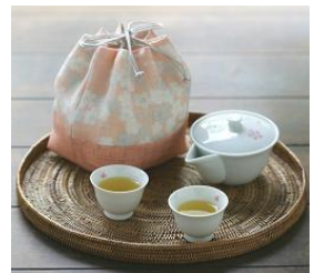
春桜旅持ち茶器巾着

奈良の地で 300 年にわたり麻を扱い続ける老舗、中川政七商店がプロデュースする「遊 中川」。急須と湯呑のセット「春桜旅持ち茶器巾着」は、ゆったりとお花見を楽しみたい方にぴったりの商品です。