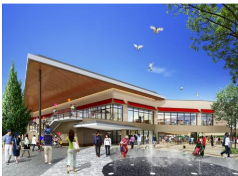
ベリーガーデンから望む