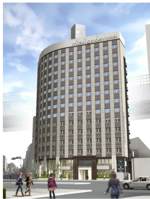
外観 完成予想 CG