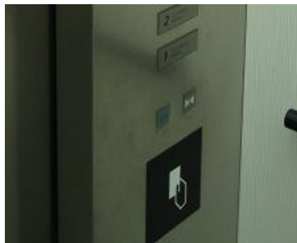
エレベータのセキュリティ制御