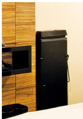
ズボンプレスサー