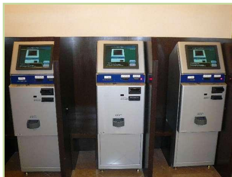
自動精算機 イメージ