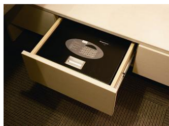
セーフティーボックス