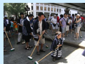
「名橋「日本橋」橋洗い」