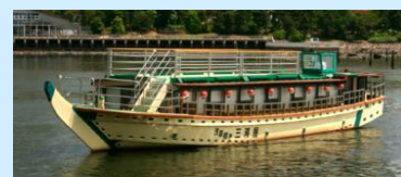
「お江戸日本橋納涼船」