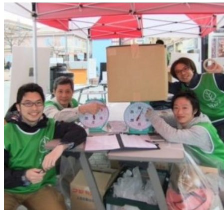
<「日本救援衣料センター」過去寄贈時の様子>