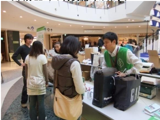
<平成 22 年 3 月実施時の様子>