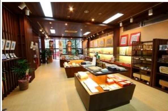
奥野かるた店 2F ギャラリー