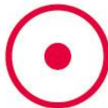
COREDO（コレド）室町インフォメーション 「日本橋案内所」