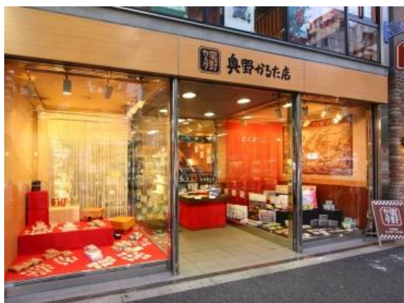
奥野かるた店 外観