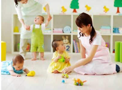
認可保育施設(※写真はイメージです) 0歳児～5歳児まで預けられる100名規模の認可保育施設。