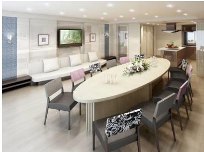
「パーティールーム」完成予想図