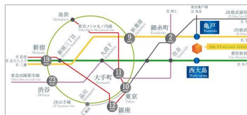
都心主要スポットへのアクセス

本物件は、JR総武線「亀戸」駅まで徒歩6分、都営新宿線「西大島」駅まで徒歩5分と駅近物件であり、東京駅まで10分(亀戸駅より)、銀座駅まで12分(亀戸駅より)、新宿まで19分(西大島駅より)と都心の主要スポットへのアクセスが良好です。通勤時間を短縮することで、家族の時間を創出できる立地となっています。