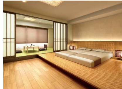
ゲストルーム「ジャパニーズスイート」 完成予想図