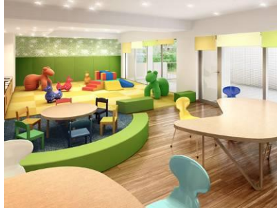
「親子カフェ」完成予想図 子供を見守りながらティータイムが愉しめるキッズコーナーとカフェコーナーをひとつにした空間。