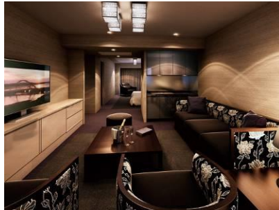
ゲストルーム「ラグジュアリースイート」 完成予想図