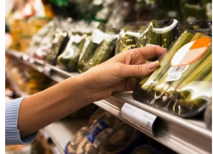
ミニショップ(※写真はイメージです) 育児用品に加え、調味料やティッシュペーパーなど身近に必要なものを取り揃えた深夜まで営業するミニショップ。