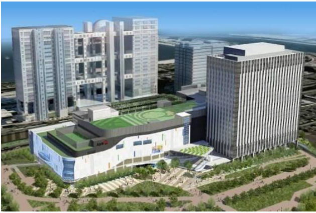
① 複合施設「(仮称) 青海Q街区計画」 全体イメージ