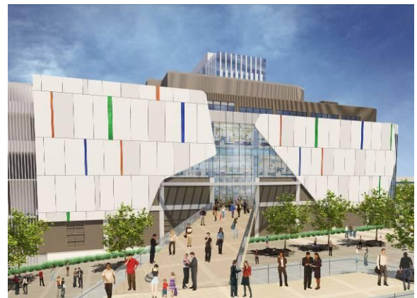
④商業施設 1F エントランス イメージ (ゆりかもめ「台場」駅側)

※「新 Zepp Tokyo (仮称)」を運営する株式会社ホールネットワークからの発表資料は、こちら をご参照ください。 http://www.sme.co.jp/pressrelease/images/20110601-2.pdf