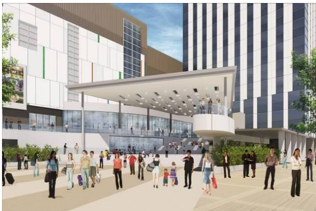
③ フェスティバル広場 イメージ