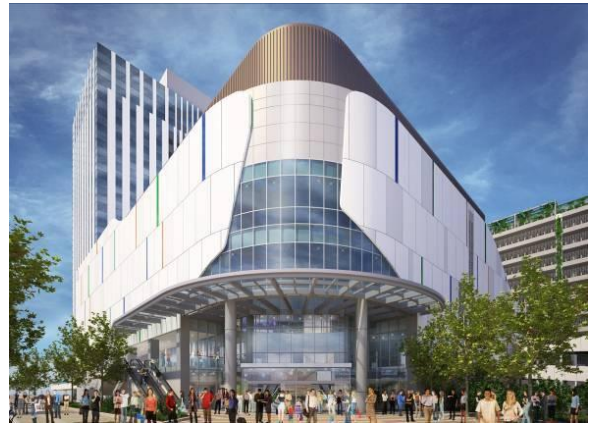
②商業施設 1F エントランス イメージ (りんかい線「東京テレポート」駅側)