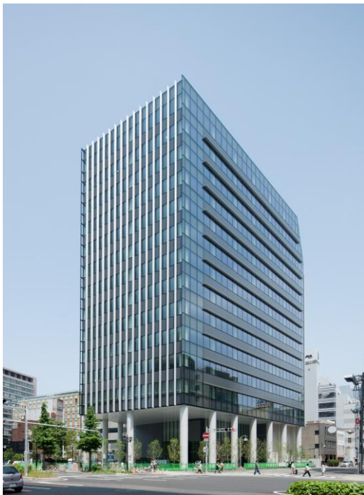
「名古屋三井ビルディング新館」外観