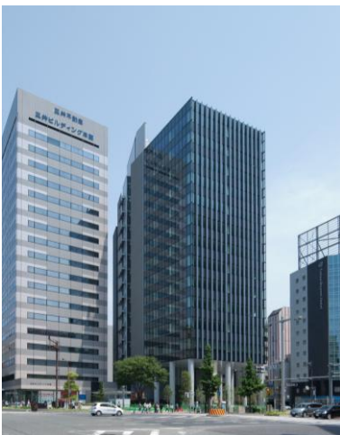
(右) 名古屋三井ビルディング新館 (左) 名古屋三井ビルディング本館