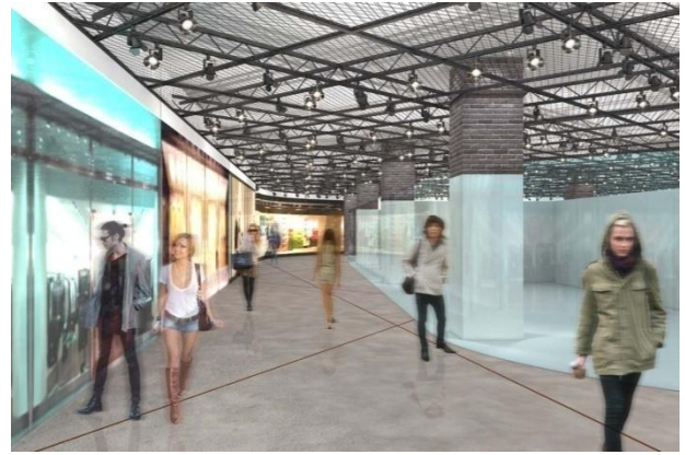
② “東京トレンドプロデュースゾーン” イメージ