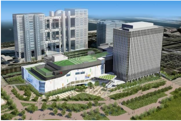
① 複合施設「(仮称) 青海Q街区計画」 全体イメージ