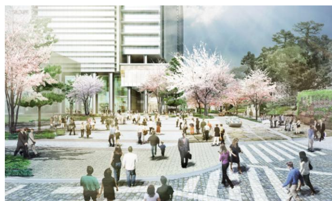
駅前に開けた広場計画 (イメージパース)