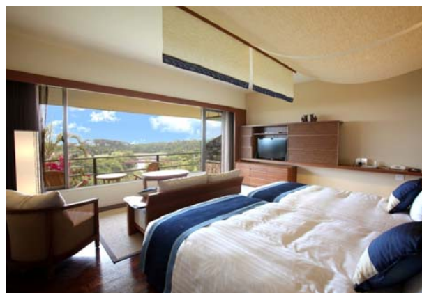
新客室オーシャンプレミア