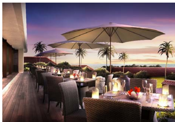
新オープンカフェ&バー