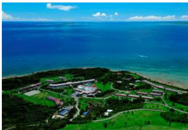
はいむるぶし全景

その他施設：センター棟（レセプション、インフォメーション、ホテルショップ、上記の飲食店舗）、展望大浴場、野外プール、ビーチハウス、ダイバーズルーム、カンファレンスルーム、レンタルカート場、テニスコート（2面）