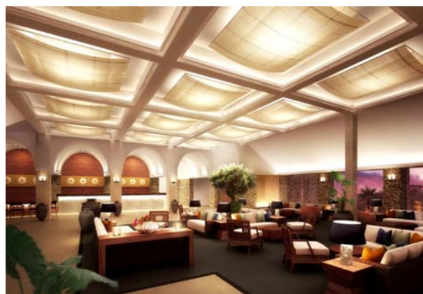
新エントランスロビー