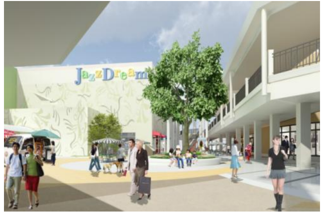
シンボルツリー周辺（イメージ）