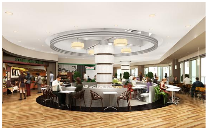
全天候型休憩スペース「ガーデンテラス」（イメージ）