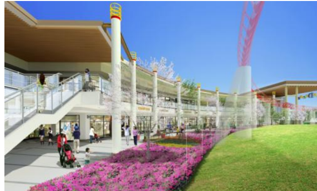
外構部分より（イメージ）