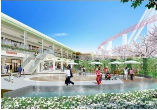
ハーモニーテラス（イメージ）