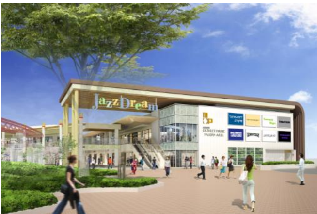
メインゲート（イメージ）