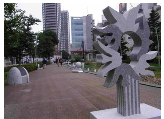
▲昨年の展示の様子