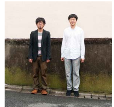
光の織機 (Canon Milano Salone 2011)