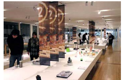
▲昨年の展示の様子

※休館日などの詳細は東京ミッドタウン・デザインハブのWEBサイト ( http://www.designhub.jp )をご覧ください