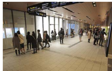
過去の展示の様子 ▲