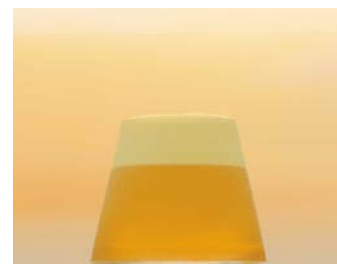
2008年のデザインコンペから生まれた人気商品「富士山グラス」