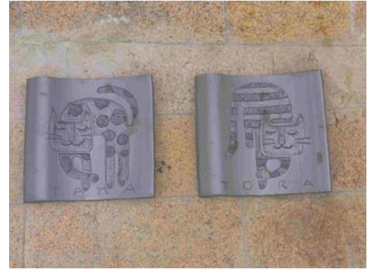
▲昨年の展示の様子