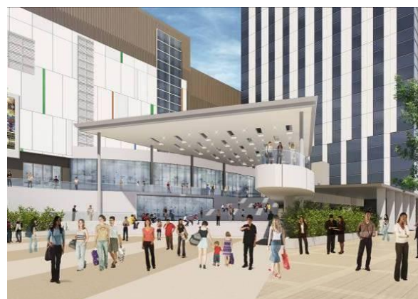
④ フェスティバル広場(仮称) イメージ