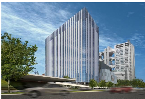
③ 「ダイバーシティ東京 オフィスタワー」 イメージ