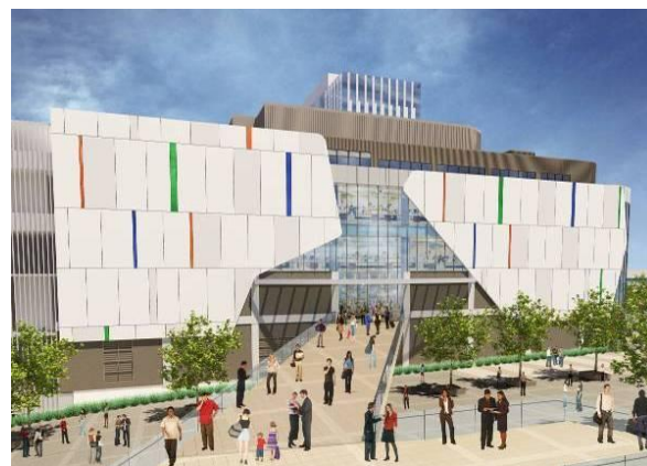
② 「ダイバーシティ東京 プラザ」 3F エントランス イメージ (ゆりかもめ「台場」駅側)