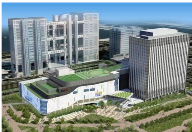
① 複合施設「ダイバーシティ東京」 全体イメージ