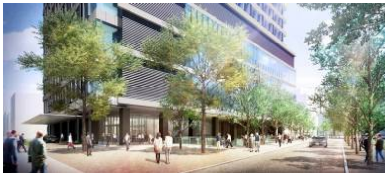
グリーンモール完成予想図