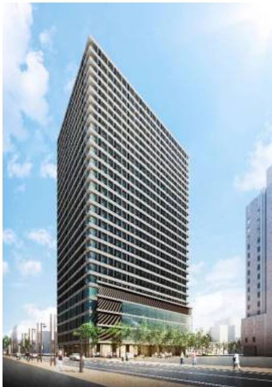
「(仮称) 新・第二豊田ビル」建物外観完成予想図 ※パースは今後変更になる可能性があります。

■三井ガーデンホテルチェーンは、現在、全国で 16 施設 4,258 室を運営しております。本ホテルに続き、今後も大都市圏や地方政令指定都市において積極的に新規展開を行うとともに、「お客様の五感を満たすホテル」、「記憶に残るホテル」を目指し、ホスピタリティー溢れるサービスの提供に努めてまいります。