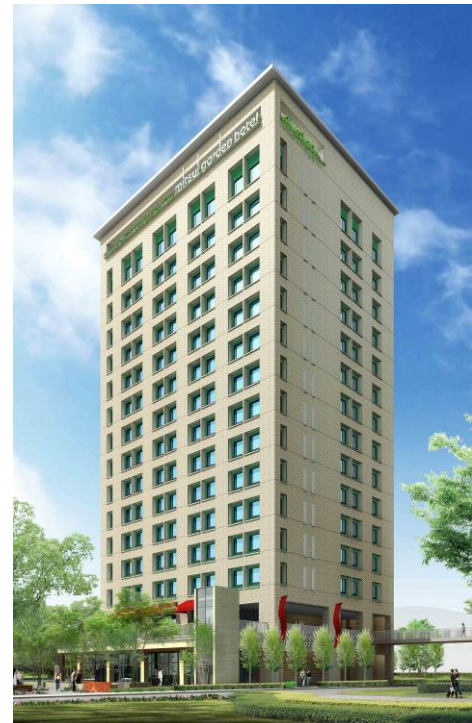
<建物外観完成予想図>