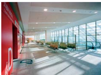
総合外来センター