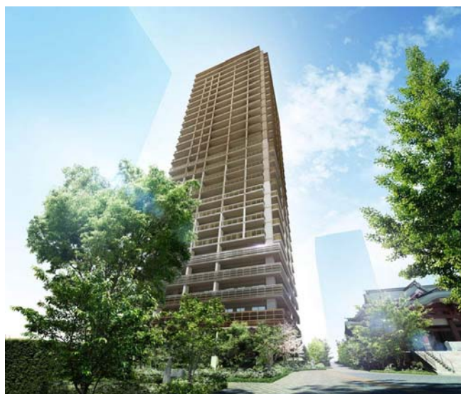
パークタワー西新宿エムズポート(外観完成予想 CG)

※「特別診察室」は、主任教授等の診察経験豊富な医師による診察・健康相談を行なうため開設された特別な診察室です(有料)。