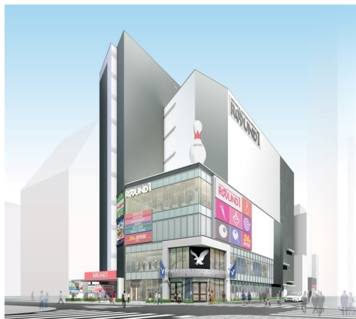
「池袋スクエア」イメージ