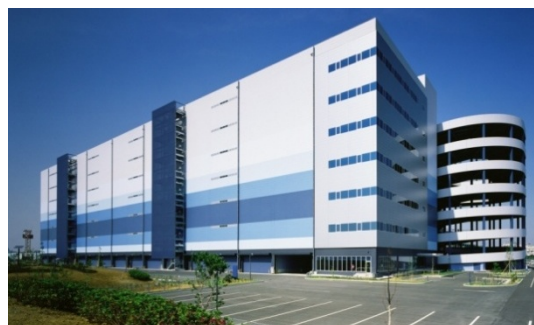
「横浜ロジスティクスパーク」外観(敷地北西側)