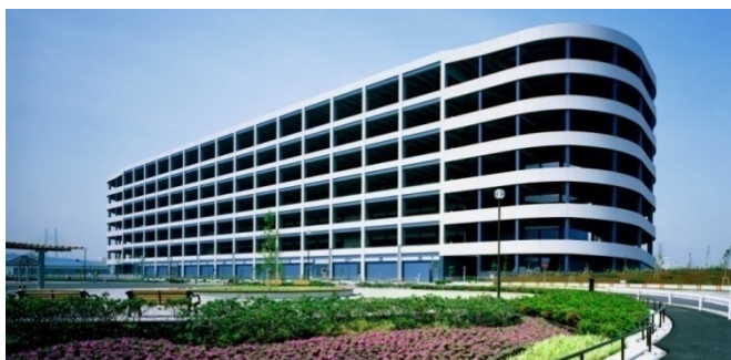
「横浜ロジスティクスパーク」外観(敷地南東側)