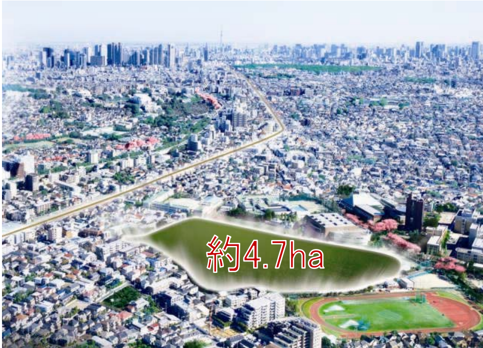
◀「桜上水ガーデンズ」建設現地 敷地空撮▶

桜上水ガーデンズは東京 23 区内最大級となる大規模団地建替プロジェクトです。従前の約 4.7ha の敷地に広がる「桜上水団地」17 棟 404 戸を「桜上水ガーデンズ」として 9 棟 878 戸に新しく建替えます。平成 14 年の参画より、住民の皆様と協議を重ね、団地再生に向けた協議を行ってまいりました。今後、急増するであろう大規模団地の建替えを見据え、「いま求められる住まいとは何か」ということを住民の皆様、野村不動産、三井不動産レジデンシャルの 3 者で徹底的に考え抜き、フラッグシップとなる物件にすべく計画いたしました。