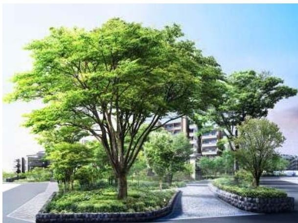
《「桜上水ガーデンズ」外観完成予想図》