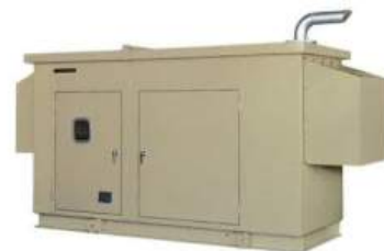
《(左)免震装置、(中)非常用飲用水生成システム (右)非常用発電機 イメージ図》