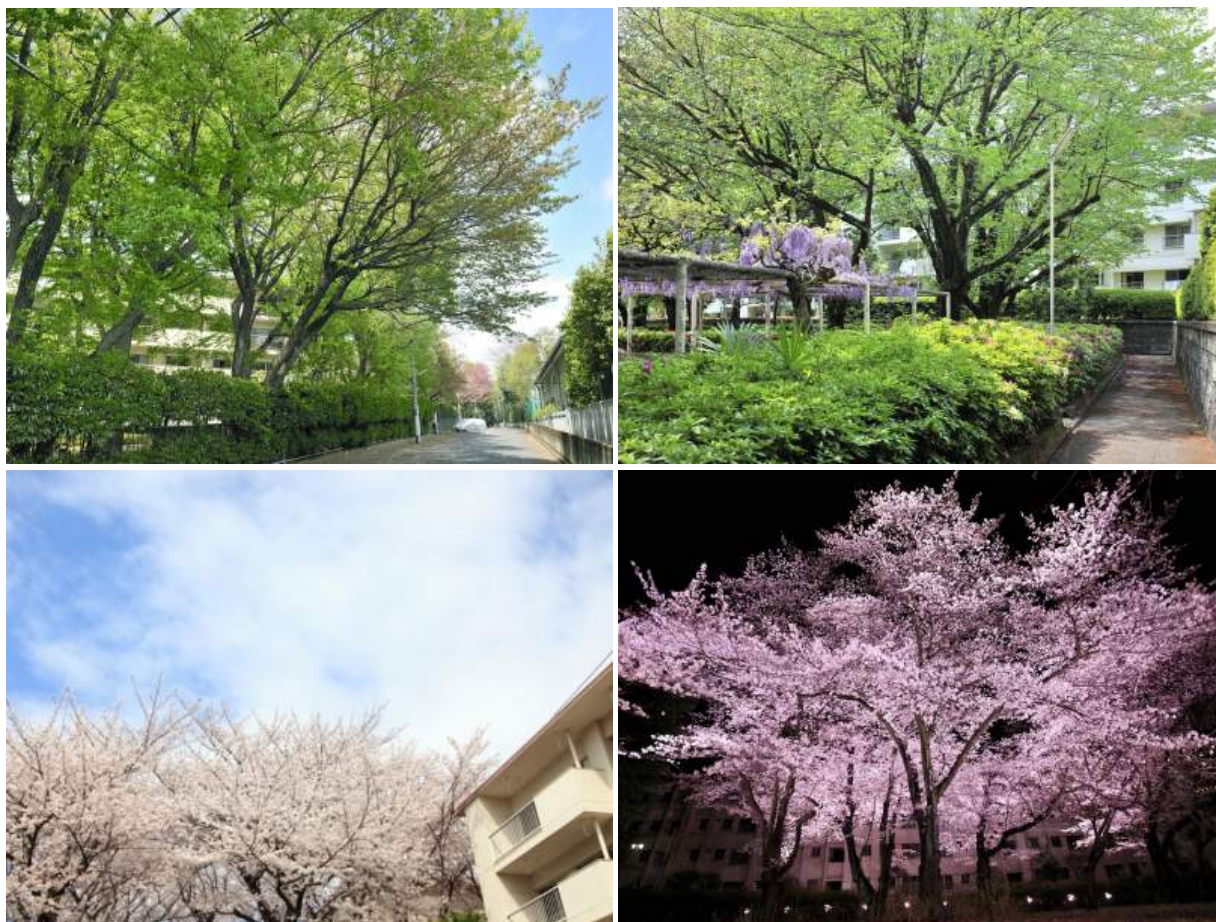
《緑豊かな「桜上水団地」写真》