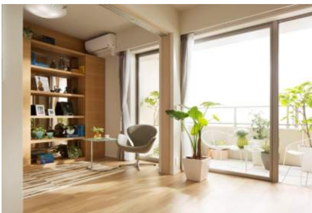
◀モデルルーム リビング・ダイニング 写真▶