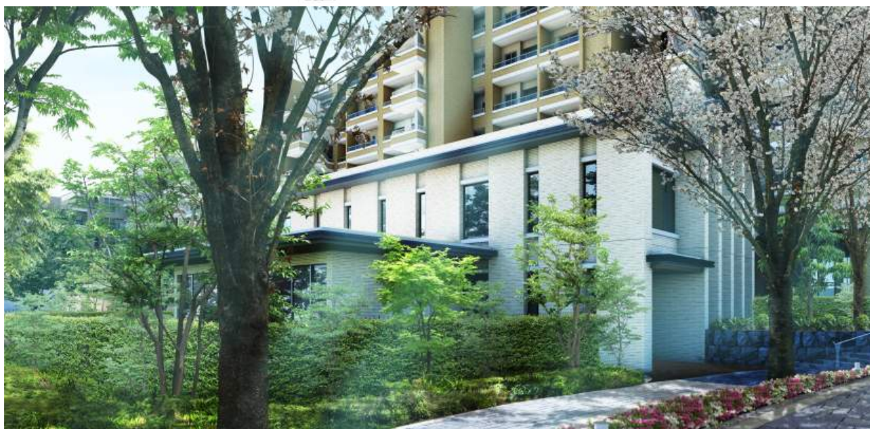
《レセプションハウス 完成予想図》

敷地内に「ビンテージガーデン」、「シーズズガーデン」、「スクエアガーデン」、「コミュニティガーデン」、「ヒーリングガーデン」の5つのテーマガーデンを配置。ただ緑を設けるだけでなく、健康器具の設置や野鳥観察などそれぞれに特色を設け、四季折々の散策が楽しみながら交流ができるようにしています。