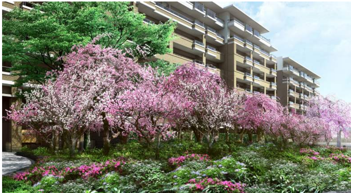
《ビンテージガーデン完成予想図》

法定の建ぺい率60%・容積率200%のところ、建ぺい率約41%・容積率約162%に抑えること、駐車場を地下・屋内化し、屋上を緑化することで空地を生み出し、ゆとりのスペースを創出しました。また、既存高木約180本に加え、約360本の高木を新植することにより、緑豊かな原風景を再生します。