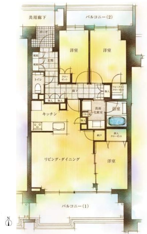
◀「桜上水ガーデンズ」代表間取り図▶

“1フロア2世帯構成で共用廊下が無くプライバシー性に優れる”、“北側・南側の両面に窓があり採光・通風に優れる”などの近年の集合住宅では失われつつある魅力的な特徴があった「桜上水団地」。それを継承し、“平均専有面積約 79 m 2 ”、“3～5戸に1基のエレベーター”、“両面バルコニー”、“天井高約2.6m”、“約2.2mのハイサッシ(※リビング・ダイニング)”など、ゆとりあるプランを再生します。