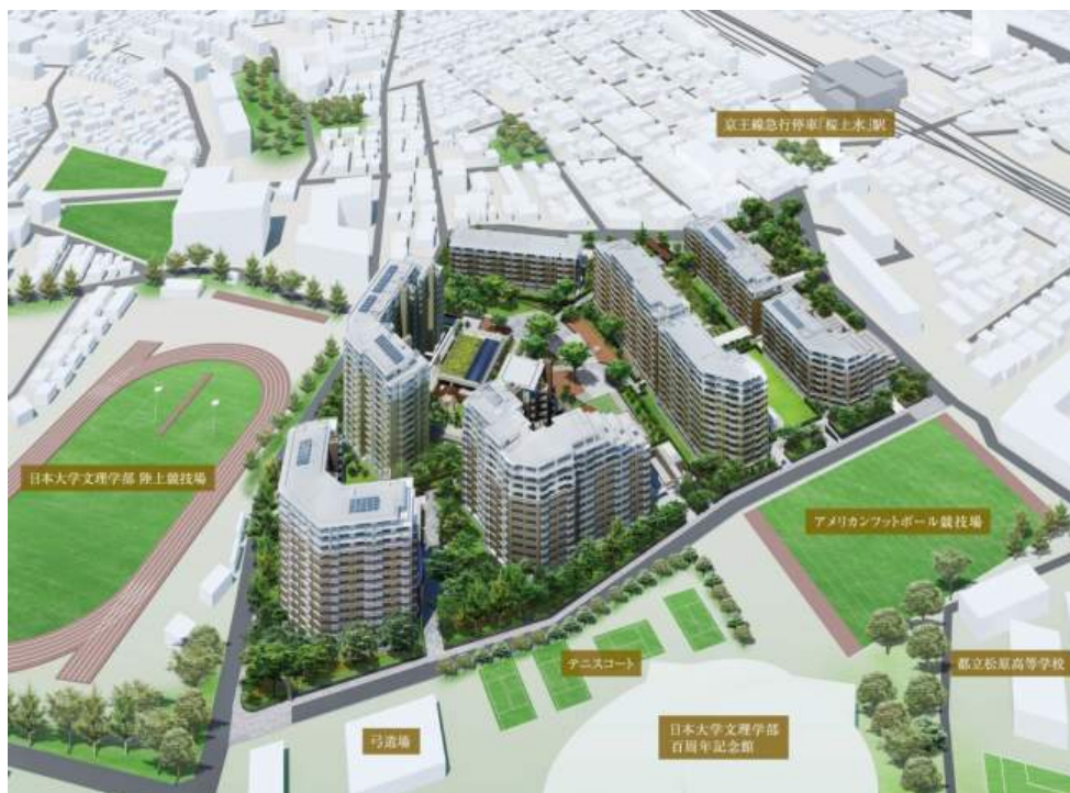
◀「桜上水ガーデンズ」完成予想図▶