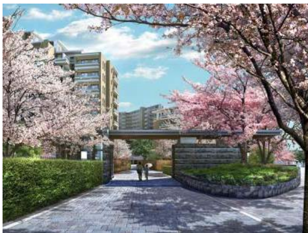
《「桜上水ガーデンズ」グランドゲート完成予想図》