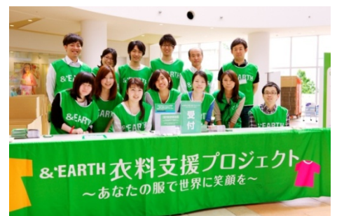
2013 年 5 月(第 9 回)実施時の様子