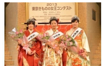
東京きもの女王2013コンテスト （2012年開催時の様子）

取材問合せ先：東京きもの振興会 TEL 03-3663-2104（平日10：00～17：00）