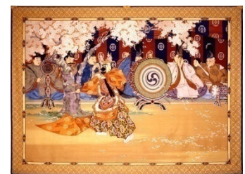
川島織物展（イメージ）