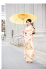
きものフォトセッション (2012年開催時の様子)