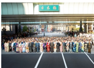
きもの大集合写真 (2012年開催時の様子)

期間中に着物を着て両百貨店のスタンプを集めると、各店先着 500 名様に、「TOKYO KIMONO WEEK 2013」オリジナルの限定手ぬぐいをプレゼントいたします。