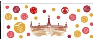
きものスタンプラリー オリジナルの限定 手ぬぐい（イメージ）