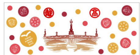
オリジナルの限定手ぬぐい（イメージ）