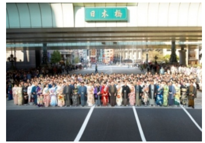
きもの大集合写真 (2012年開催時の様子)