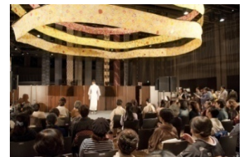
きものサロネ in 日本橋 （2012年開催時の様子）