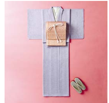
きもの新ショップ 「華むすび」（イメージ）