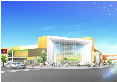
「メープル・モール」外観イメージ (羊ヶ丘通側)

また、第 1 期施設も改めて「クローバー・モール」と命名し、新たに 4 店舗が出店、それにより北海道・東北エリア最多 174 店舗のアウトレットモールとして、国内外の多くのお客さまが“日常の中の非日常空間”としてよりお楽しみいただける施設となります。