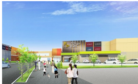
「メープル・モール」外観イメージ (北広島 IC 側)