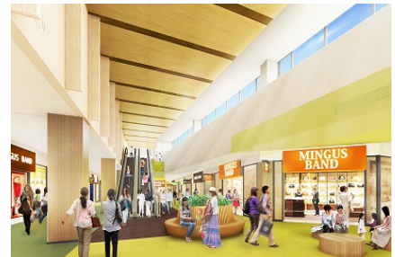
「メープル・モール」内観イメージ