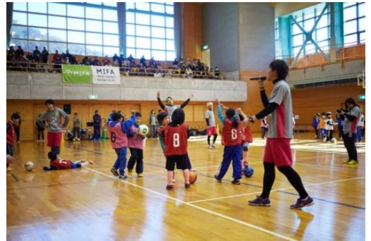
「MIFA スマイルプロジェクト」の様子

MIFA は「音楽だけではできないこと。フットボールだけではできないこと。音楽とフットボールだからできること」を目指しています。今回の「MIFA Football Park 新豊洲(仮称)」は、MIFA の理念を体現した場となります。