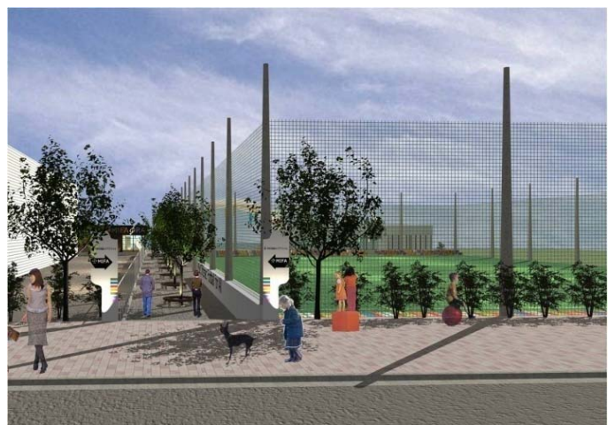
フットボールエリアイメージ