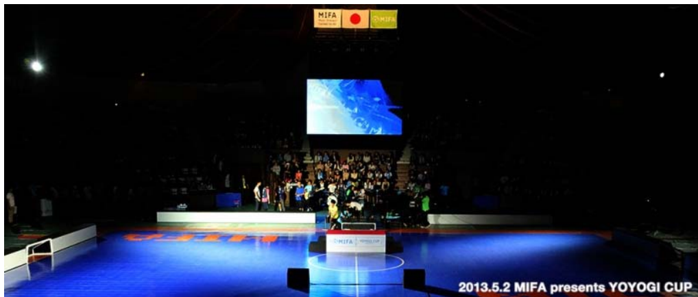
「MIFA presents YOYOGI CUP」

また、2013年5月には、アーティストのパフォーマンスと3on3のフットボールマッチを組み合わせたイベント「MIFA presents YOYOGI CUP」を代々木体育館で開催しました。会場では、ウカスカジーによる音楽ライブ、サッカー元日本代表選手や日本フットサル界の頂点「フリーグ」から6チームが参戦したフットボールマッチなど、音楽とフットボールを体験できるイベントとなりました。今年は規模を拡大し、4月に大阪、5月に東京(日本武道館)で開催する予定です。