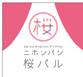
ニホンバシ桜バル ログマーク