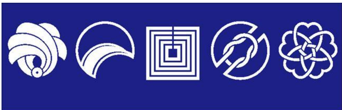
暖簾 イメージ（左から、栄、橋、楽、粋、桜）

概要：江戸時代、日本橋の商店の軒先を彩っていた暖簾の街並みを再現します。日本橋の歴史や文化をキーワードに 5 つのデザインコンセプト（「栄：コレド室町」「楽：コレド室町 2」「桜：コレド室町 3」「橋：コレド日本橋」「粋：日本橋三井タワー」）を設定。最大で 2m×10mの「コレド室町」の大暖簾など 5 つの商業施設に、日本橋三越本店の既存の「大暖簾」を加えた全 6 施設のエンタランスに設置し、暖簾めぐりをお楽しみいただけます。デザイナーには、日本橋に生まれ、「とらや」（東京ミッドタウン）や資生堂本社（銀座）など、数多くの暖簾デザインに携わってきた白馬實（はくばまこと）氏を採用。