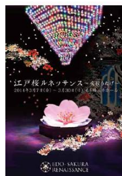
江戸桜ルネッサンス & 夜桜うたげ