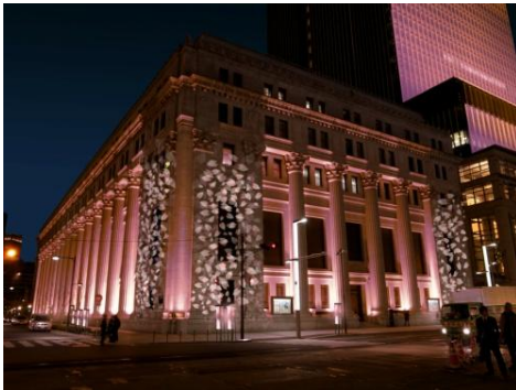
三井本館 イメージ