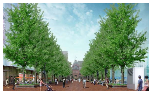
「札幌市北3条広場」完成イメージ