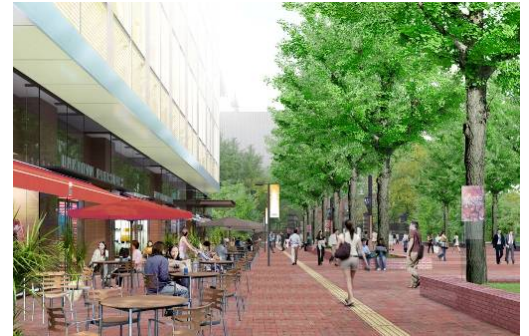
1階「オープンテラス」イメージ

札幌市北3条広場側に面した1階部分には、オープンカフェやオープンバルを配置し、広場と一体となった賑わいを創出します。季節の良い時期には、オープンテラスでイチョウ並木の木漏れ日と爽やかな風を感じながら、豊かな時間を過ごせる心地の良い空間を提供します。