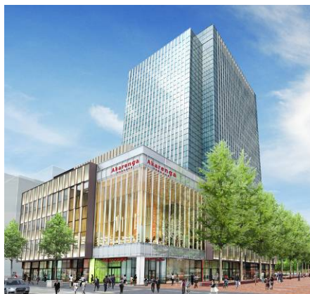
「赤れんが テラス (Akarenga TERRACE)」外観イメージ