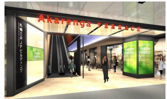
地下1階「エントランス」イメージ

本商業施設は平日1日約8万人が通行する札幌駅前地下歩行空間「チ・カ・ホ」からダイレクトアクセス可能な場所に位置しています。こうした立地特性を生かし、明るく開放的な環境を地下エントランスに整備します。光天井やデジタルサイネージなどを設置するほか、テーブルやイスなどを配したテラスを設け、憩いの空間を創出します。また、地下エントランスは、地上へのスムーズなアプローチとしてもご利用いただけるため、エリア全体の回遊性を高めます。