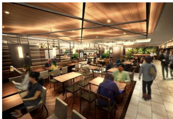
3 階「バルテラス」客席イメージ