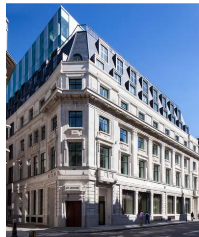
「1 エンジェルコート」イメージパース