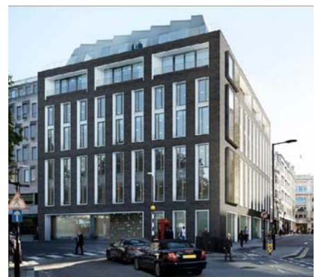
5 Hanover Square 外観パース