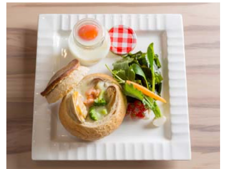
三陸シーフードチャウダー