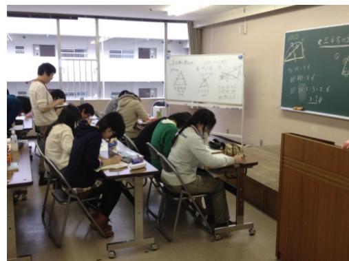
現地に講師を派遣しての学習支援の様子