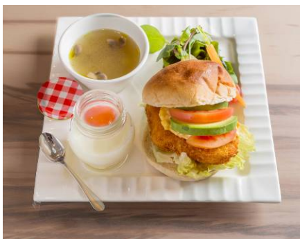
三陸メカジキバーガー