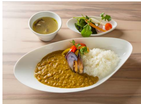
フィッシャーマンカレー